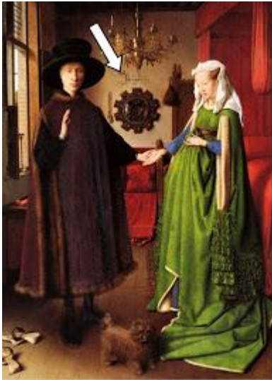
Van Eyck 1434

Au XV ème siècle l'autoportrait apparaît discrètement dans certaines peintures à la façon d'une signature. Perdu parmi d'autres personnages ou caché dans une scène, le peintre perd discrètement son anonymat et devient reconnaissable.